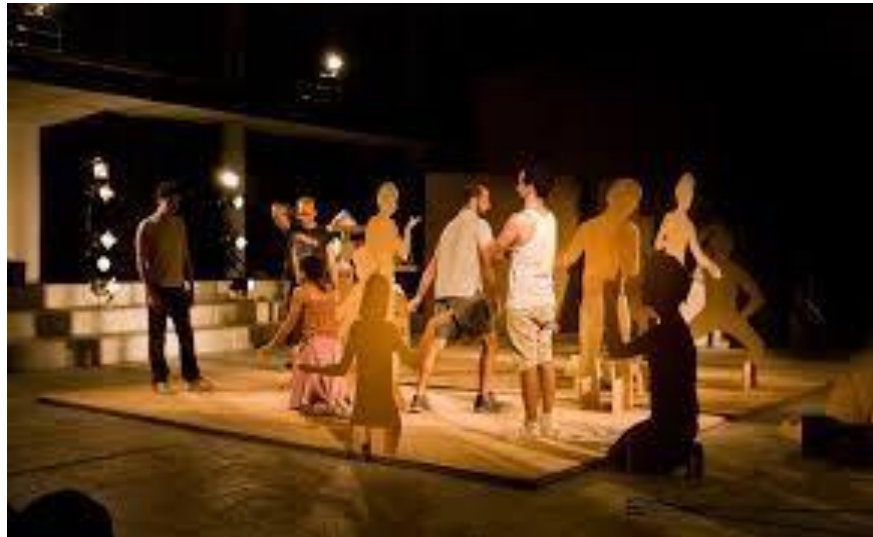
Escena Cristo , 2008, en página oficial de la Compañía de Teatro de Chile.

El ejercicio de acartonar la silueta de los actores en escena evidencia el vínculo entre el cuerpo, su materialidad y medialidad. A través de esta escena, los cuerpos de los actores se presentan y desaparecen a medida que las siluetas de cartón van siendo sacadas por los mismos actores, produciéndose así un juego entre ausencia-presencia, cuerpo-materialidad, realidad-representación.