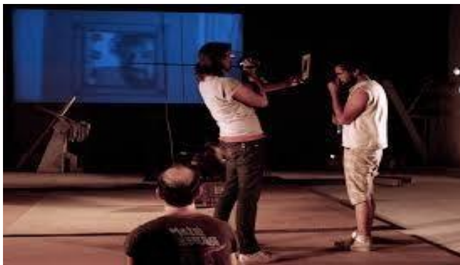
Escena de Cristo 2008. Matucana 100 .

El ejercicio de establecer una improvisación simulada es una constante a lo largo de la obra. Sin embargo, el uso de cámaras y grabaciones en vivo produce la sensación de quiebre con la simultaneidad de la escena. El video exhibido al final de la obra sobre el proceso investigativo nos devela ese carácter de representar aquello que es imposible representar y que a través de la reiteración nos invita a poner en cuestionamiento lo que conocemos y cómo lo conocemos. De esta forma, el manuscrito que se exhibe en esta grabación sobre un supuesto guion a seguir por los actores contiene la suplantación de los mismos actores como personajes e, incluso, lo que el público debería percibir o entender de la obra. Existe otro recurso multimedial que viene a poner en duda el binomio realidad-ficción: la proyección a través del video de la misma escena presentada en vivo, pero con alguna diferencia que el espectador debe revelar. Un ejemplo evidente es la utilización de marcas dibujadas con colores en las vestimentas de los actores dentro de la proyección del video para establecer la diferencia entre la grabación y la escena en vivo.