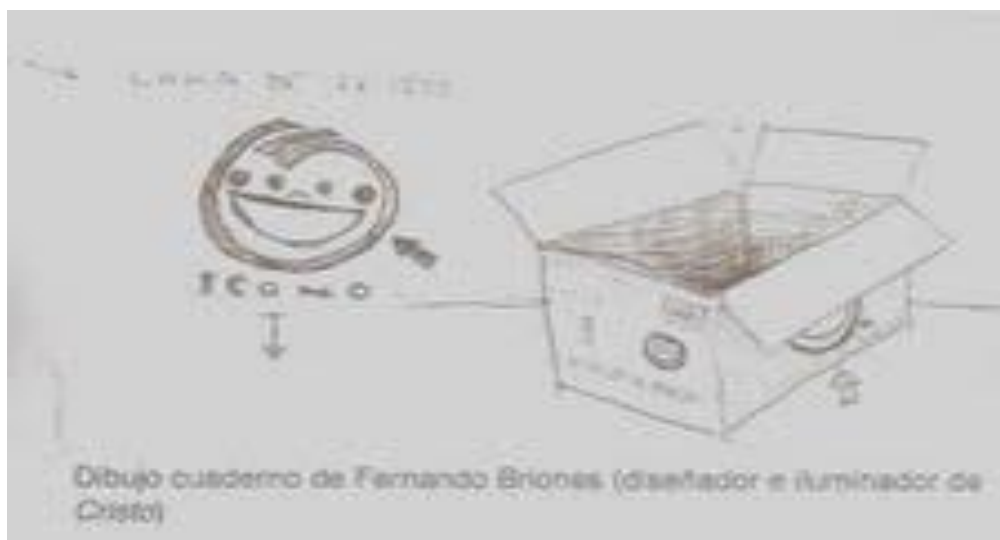
Imagen que aparece en el cuaderno de notas de la obra.

El ejercicio de acartonar también juega como suplantación de la figura de Cristo y del cuerpo actoral. Al recortar el cartón se establece un juego de ausencia y presencia . Primero el referente de crucifixión de Cristo se transforma en la figura de un Cristo con cabeza de caja de papas fritas, haciendo alusión a la posibilidad de reconstruir un referente trascendental a través de desechos o íconos de la cultura globalizada.