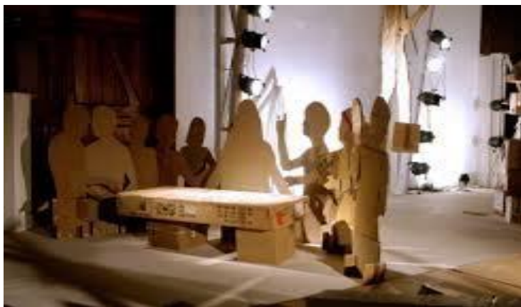
Escena Cristo 2008.

El cartón además tiene la función de suplantar el cuerpo actoral. En la imagen que se presenta a continuación se observa una de las escenas más representativas sobre la utilidad y significación del cartón en la obra. Este material no sólo logra deconstruir la imagen de Cristo, sino que además sustituir el cuerpo y acción de los actores en escena. A través del despliegue de las figuras de cartón, se van construyendo las acciones de los protagonistas, dando la sensación en los espectadores de simultaneidad y simulacro de la realidad.