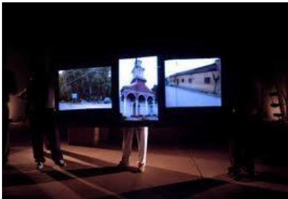
Escena de documental sobre Cristo de Curimón, 2008.

La utilización de cámaras en vivo viene a develar el carácter ilusorio de realidad. Si bien dentro del concepto de transmedialidad la cámara funciona rompiendo el sistema tradicional de representación y como posibilidad de entender el objeto estético desde diversos ángulos, en este montaje la Compañía trabaja con la cámara como material que revela la simultaneidad de la ficción entre videoescenario. Para la dramaturga y directora, Manuela Infante, existe una posibilidad de poner en crisis a la teatralidad iv a través de la improvisación simulada, ya que la improvisación real vincula la distinción entre realidad y ficción, en cambio, la improvisación simulada pone en crisis o cuestionamiento esa distinción: